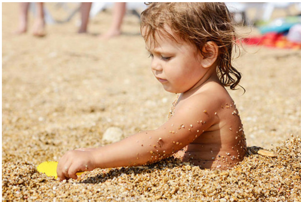
Każde wakacje to debata o dopuszczalności negliżu na plażach.

ŁUKASZ TRYBULSKI ( HTTP://NATEMAT.PL/U/1893,LUKASZ-TRYBULSKI ) 3 tygodnie temu