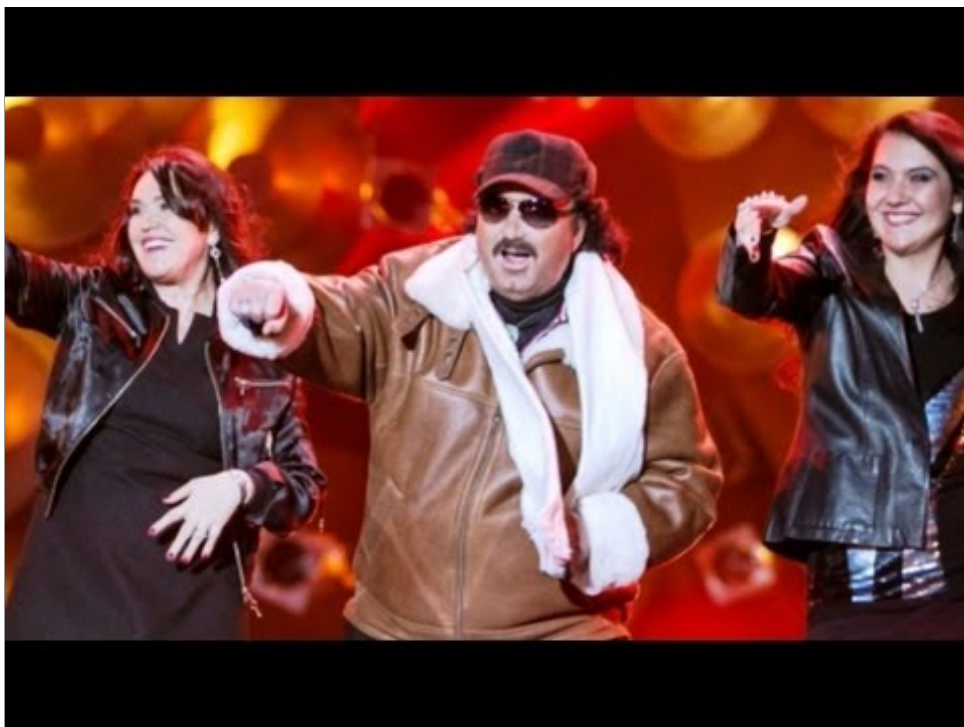
Krzysztof Krawczyk na Sylwestrze we Wrocławiu