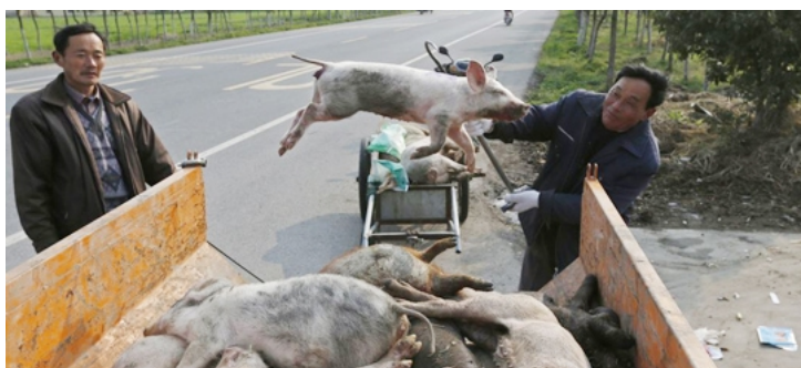
چین: مردار بونهه ی زیتر له 6000 بهراز بههوی نهخوشی نهغولوزای بهرازوه (رویتهرز)